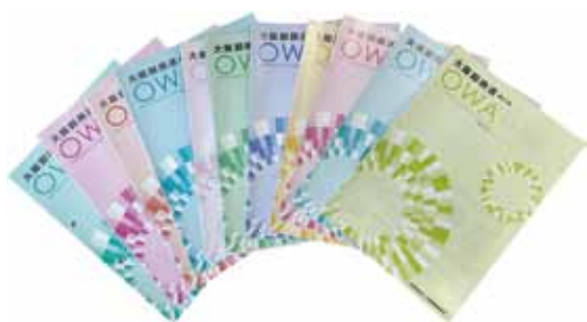
▲近年の大阪卸商連(OWA)

そんな中で、連合会の情報を発信する媒体として機関紙「大阪卸商連 (OWA)」が誕生。当機関紙では、活動の実施報告や今後の事業日程、宣伝などを中心に掲載。加入組合様、賛助会員様に連合会の現状をお伝えしてまいりました。右に掲載しているのが、「大阪卸商連 (OWA)」の第1号です。当時は今の冊子タイプではなく、新聞タイプのデザインでした。現在と同じく、理事長の挨拶から始まり、役員名簿や活動報告などが掲載されています。今後も引き続き大阪卸商連 (OWA) では、皆様に連合会の今をお届けいたしますので、変わらぬご愛顧のほどお願いいたします。